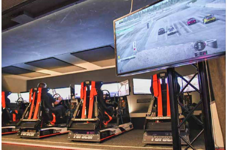
Neljän Foracer-ajosimulaattorin kisaa seurataan isommalta näyttöltä katsomon puolella. Foracer Event Roomin monet tietokoneet ja näytöt on toimittanut Jimm's PC-Store.